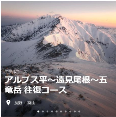
モデルコース アルプス平～遠見尾根～五竜岳 往復コース

2日目◆4:00 起床～五竜山荘 4:20→5:20 五竜岳(2,814m)ご来光 5:27→6:30 五竜山荘 8:00→9:10 西遠見山(2,268m)→9:50 大遠見山(2,106m)→10:30 中遠見山(2,037m)→12:00 地蔵の頭(1,673m)→12:20 白馬五竜テレキャビンアルプス平駅(1,515m)→五竜エスカルプラザ(温泉入浴/650円)